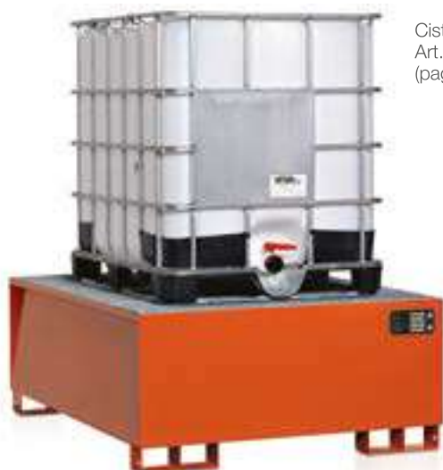
Cisternetta Art. 0710 (pag. 149)