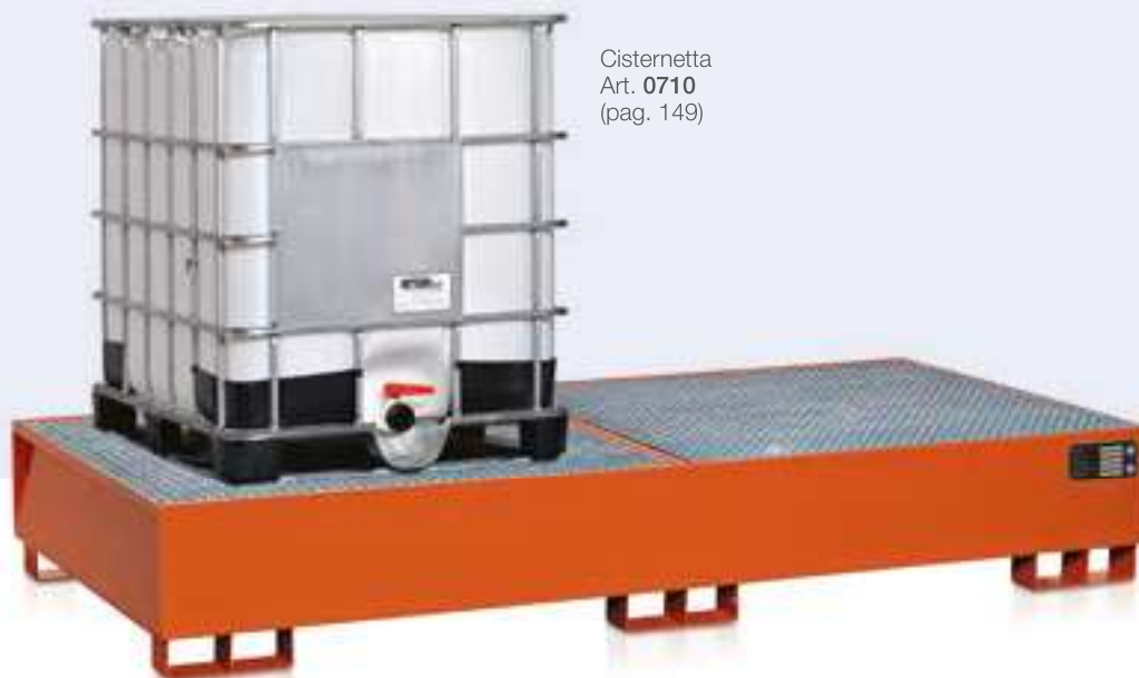
Cisternetta Art. 0710 (pag. 149)