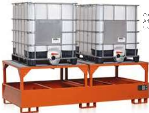
Cisternette Art. 0710 (pag. 149)

Costruite interamente in lamiera di acciaio. Sono predisposte per ricevere il supporto inclinato per le operazioni di travaso e svuotamento delle cisternette. I piani di appoggio, asportabili, sono zincati a caldo, realizzati in piatto di mm. 30 x 2 sp. e formano una griglia con maglia di mm. 55 x 68. Vasche e strutture sono movimentabili con carrello elevatore.