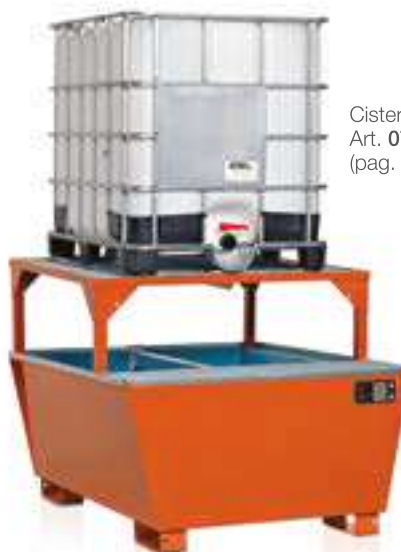
Cisternetta Art. 0710 (pag. 149)