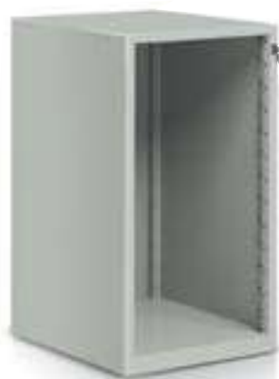
ARMADIO Art. B1320