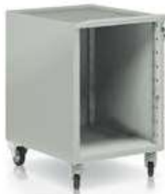
CARRELLO Art. B1325

DIMENSIONI ESTERNE LxPxH (mm) 550 x 665 x 1000