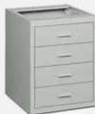
CASSETTIERA Art. BL36166