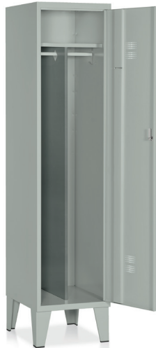
ARMADIO Art. E520

Con tramezza. Vano cappelliera mm. 345 x 390 x 165 h. utile.