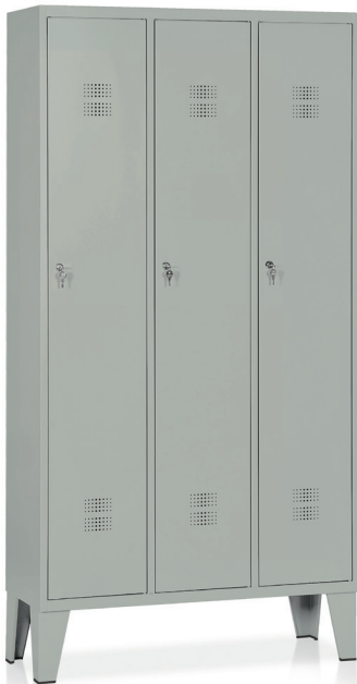
ARMADIO Art. E504