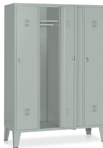
ARMADIO Art. E516