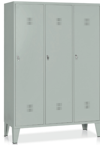
ARMADIO Art. E524