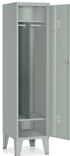
ARMADIO Art. E526

Con tramezza. Vano cappelliera mm. 345 x 390 x 165 h. utile. Vano portascarpe mm. 240 h. utile.