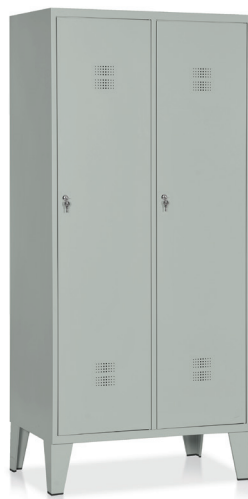
ARMADIO Art. E528