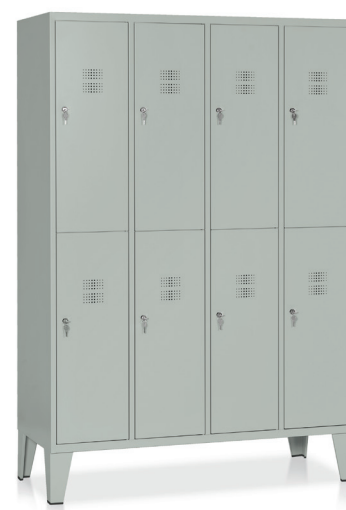
ARMADIO Art. E546