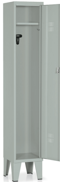
ARMADIO Art. E500

Vano cappelliera mm. 255 x 285 x 165 h. utile.