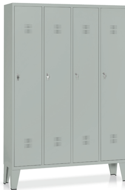
ARMADIO Art. E506