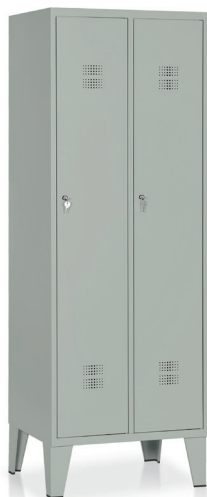
ARMADIO Art. E512