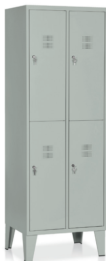
ARMADIO Art. E542