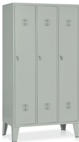
ARMADIO Art. E514