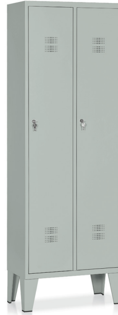
ARMADIO Art. E502