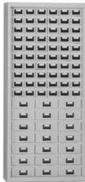
Art. E905 senza ante. E906 con ante.