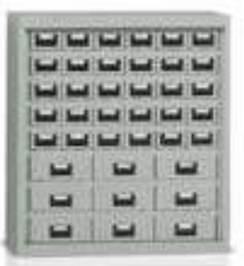
Art. E920 senza ante. E921 con ante.