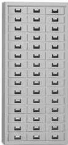
Art. E900 senza ante. E901 con ante.

Costruiti in lamiera di acciaio di prima scelta spessore 8/10 stampata e sagomata a freddo. Le ante sono dotate di serratura con linguetta. I cassetti possono essere in lamiera oppure in plastica, corredati di 2 separatori mobili e di etichetta in cartoncino bianco con protezione in PVC trasparente.