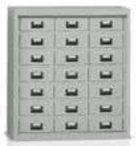
Art. E925 senza ante. E926 con ante.