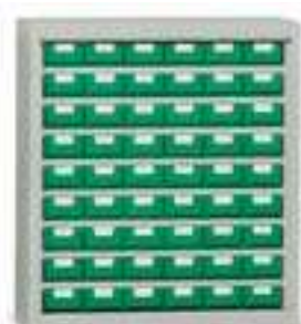
Art. E225 senza ante. E224 con ante.