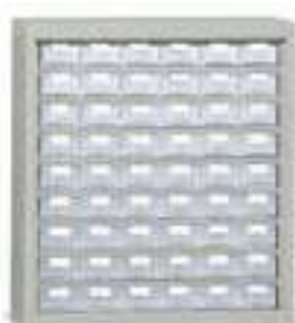
Art. E229 senza ante. E228 con ante.